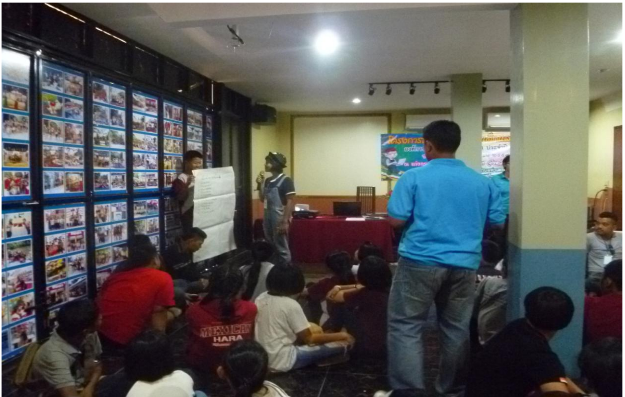
รูปภาพ การสรุปกิจกรรมสร้างจิตสำนึก เสริมสร้างความสามัคคี สร้างความผ่อนคลาย ลดความเครียด การพัฒนาแบบองค์รวมทั้ง ๕ ด้าน