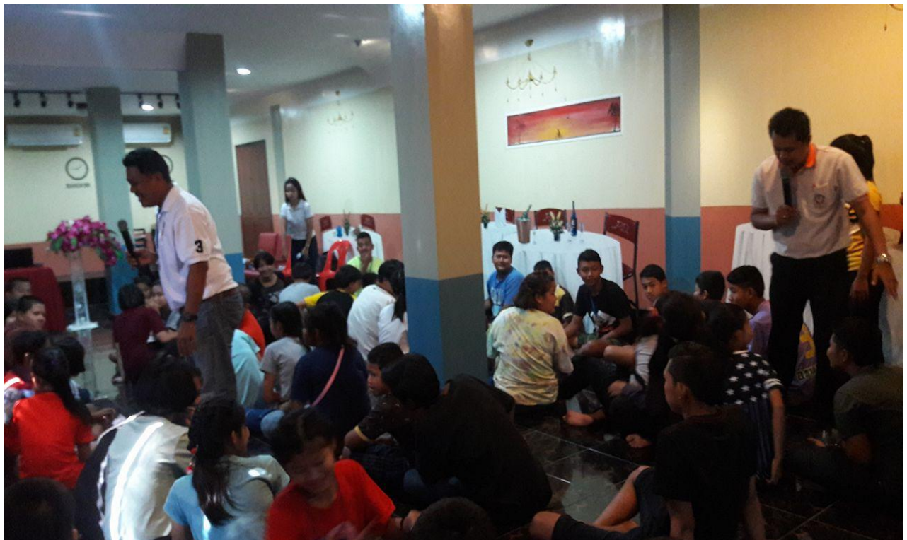
รูปภาพ กิจกรรมอบรมให้ความรู้เกี่ยวกับการปกป้องคุ้มครองเด็ก ตาม พรบ.คุ้มครองเด็ก พ.ศ.๒๕๔๖