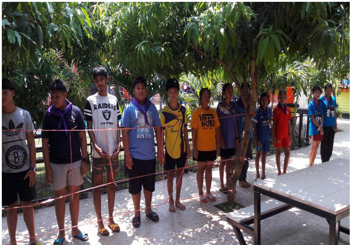
รูปภาพ กิจกรรมอบรมให้ความรู้เกี่ยวกับการส่งเสริมการพัฒนาเด็กและเยาวชน

โครงการพัฒนาคุณภาพเด็กและเยาวชน องค์การบริหารส่วนตำบลท่าเสา ประจำปี ๒๕๕๘